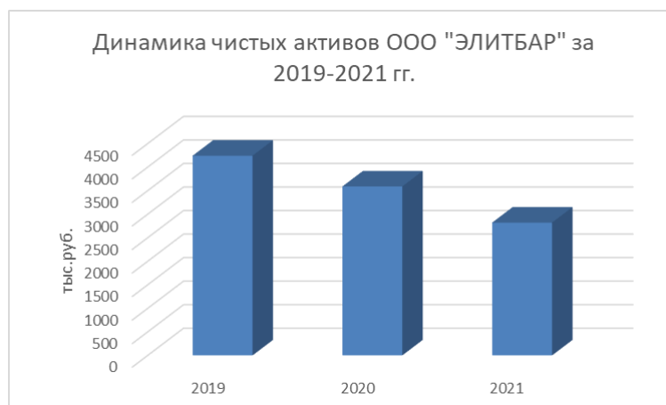
Рисунок 1 - динамика чистых активов ООО «ЭЛИТБАР» ЗА 2019-2021 гг.

На следующем рисунке 2 наглядно представлена динамика чистых активов ООО «ЭЛИТБАР» за 2019-2021 гг.